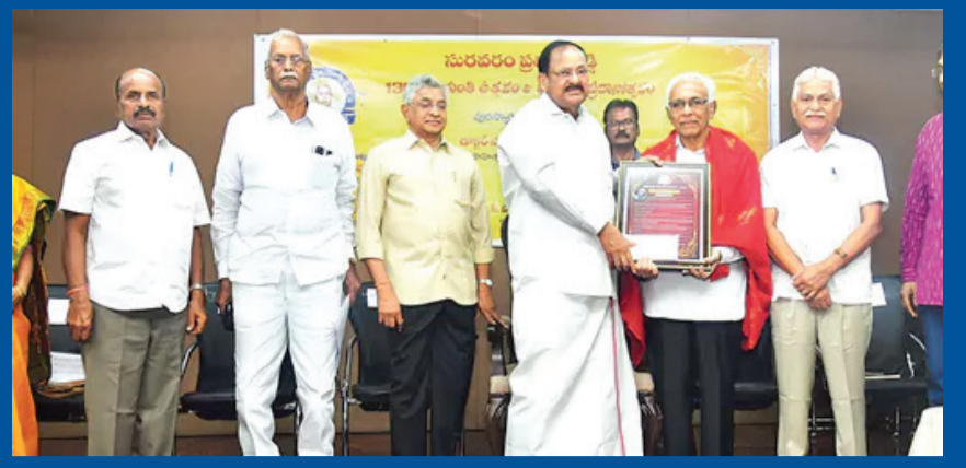
నిజాం పాలనలో తెలుగు సంస్కృతిని వికసించజేసిన మహానీయుడు సురవరం 2లో..

సంపుటి - 02 | సంచిక - 351 | తెలంగాణ | శుక్రవారం | తేదీ: 29.05.2026 | ఎడిటర్ : మదూరి శ్రీరామ్ | పేజీలు 8 | వెల రూ.3