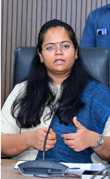
వాలని సూచించారు రైతులకు ధాన్యం కొనుగోలులో సమస్యలు, సంహేళ పరిష్కారం కోసం జిల్లా సివిల్ సప్లై కార్యాలయంలో ఏర్పాటు చేసిన టోల్ ఫ్రీ నెంబర్/కంట్లో టాం నంబర్, 9391942254 ను సంప్రదించాలని ఆమె ఆ ప్రకటనలో పేర్కొన్నారు.

దృష్టిలో ఉంచుకుని జిల్లా యంత్రాంగం అప్రమత్తంగా వ్యవహరిస్తూ కొనుగోలు కేంద్రాల్లో ధాన్యం తడవకుండా తగిన రక్షణ చర్యలు చేపడుతోందన్నారు. అవసరమైన చోట టార్నాల్స్, నిల్వ సదుపాయాలు, వేగవంతమైన రవాణా ఏర్పాట్లు కల్పిస్తూ రైతులకు ఎలాంటి ఇబ్బందులు తలెత్తకుండా అన్ని చర్యలు తీసుకుంటున్నట్లు పేర్కొన్నారు. ప్రాక్యూర్మెంట్ కు సంబంధించిన అన్ని ఏజెన్సీలు, సంబంధిత శాఖల అధికారులు, డిఆర్డీఓలు, డిసీఓలు, జీసీసీ ప్రతినిధులు, ధాన్యం కొనుగోలు కేంద్రాల ఇంజనీర్లు అప్రమత్తంగా ఉండాలని ఆదేశాలు జారీ చేసింది ప్రతినిధులు తెలిపారు. వర్షాల వచ్చే పరిస్థితుల్లో కొనుగోలు కేంద్రాలకు వచ్చిన ధాన్యానికి వర్షం వలన ఎలాంటి నష్టం కలగకుండా అవసరమైన చోట టార్నాల్స్ కప్పి భద్రపరచాలని సూచించినట్లు పేర్కొన్నారు. ధాన్యం కొనుగోలు కేంద్రాలను సంబంధిత శాఖల అధికారులు నిరంతరం పర్యవేక్షిస్తూ రైతుల సమస్యలను వెంటనే పరిష్కరిస్తున్నారని తెలిపారు. కొనుగోలు ప్రక్రియలో పాదరక్షక పాటిస్తూ రైతులకు సకాలంలో వెల్లింపులు జరిగేలా చర్యలు తీసుకుంటున్నట్లు పేర్కొన్నారు. ధాన్యం కొనుగోలు పై రైతులు అందోళన చెందాల్సిన అవసరం లేదని, ప్రభుత్వం రైతులకు అన్ని విధాలుగా అండగా ఉంటుందని హామీ ఇచ్చారు. రైతులు సమీప కొనుగోలు కేంద్రాల్లోనే ధాన్యాన్ని విక్రయించి ప్రభుత్వ సేవలను సద్వినియోగం చేసుకో