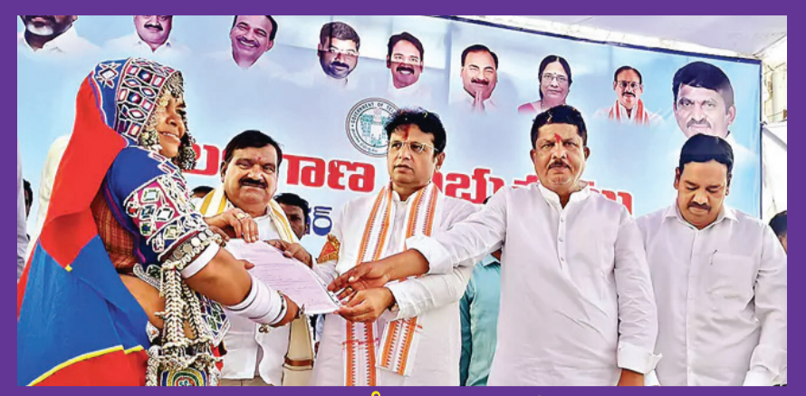
అర్హులైన పేదలందరికీ దళలవారిగా పక్కా ఇళ్లు : మంత్రి శ్రీధర్ బాబు 2లో..

సంపుటి - 02 | సంచిక - 350 | తెలంగాణ | గురువారం | తేదీ: 28.05.2026 | ఎడిటర్ : మదూరి శ్రీరామ్ | పేజీలు 8 | వెల రూ.3