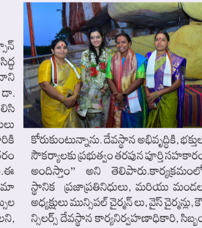
కోరుకుంటున్నాను. దేవస్థాన అభివృద్ధికి, భక్తుల సౌకర్యాలకు ప్రభుత్వం తరఫున పూర్తి సహకారం అందిస్తాం" అని తెలిపారు. కార్యక్రమంలో స్థానిక ప్రజాప్రతినిధులు, మరియు మండల అధ్యక్షులు మున్సిపల్ చైర్మన్లు, వైస్ చైర్మన్లు, కౌన్సిలర్స్ దేవస్థాన కార్యనిర్వహణాధికారి, సిబ్బంది, భక్తులు పాల్గొన్నారు.