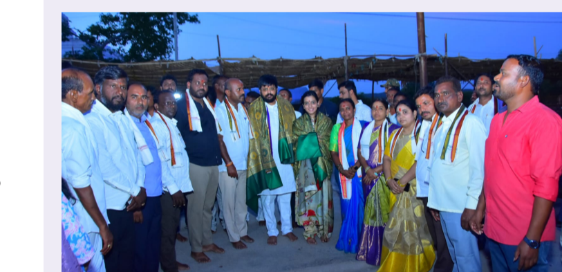
మయ్య, గుడ్ల పెద్ద సమయ్య, చిన్న సమయ్య, గౌరవ రవి భక్తులు వివిధ గ్రామాల నుంచి విచ్చేసిన కుల బాంధవులు కదితరులు పాల్గొన్నారు.