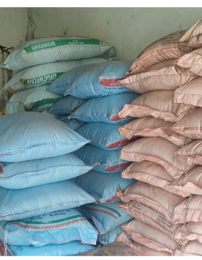
కొవ్వల రైతులు ప్రభుత్వాన్ని కోరుతున్నారు.

నే నిబంధనలు ఉన్నప్పటికీ, వాటిని పట్టించుకోవడం లేదని రైతులు అంటున్నారు. ఇక ఎరువుల కొనుగోలుకు వెళ్లిన రైతులకు అవసరం లేని పురుగుమందులు, ఇతర వ్యవసాయ సామగ్రిని కూడా తప్పనిసరిగా కొనుగోలు చేయాలంటూ షరతులు పెడుతున్నారని ఆరోపిస్తున్నారు. దీనిపై ప్రశ్నిస్తే "ఎరువులే లేవు.. వెళ్లిపోండి" అంటూ కొందరు వ్యాపారులు నిర్లక్ష్యంగా వ్యవహరిస్తున్నారని రైతులు ఆవేదన వ్యక్తం చేస్తున్నారు. ఈ పరిస్థితులపై వ్యవసాయ శాఖ అధికారులు క్షేత్రస్థాయిలో తనిఖీలు చేపట్టడం లేదని రైతులు విమర్శిస్తున్నారు. రైతులకు అవసరమైన సమయంలో ఎరువుల లభ్యత, ధరల నియంత్రణ, సరైన సలహాలు అందించాల్సిన అధికారులు స్పందించకపోవడంతో వ్యాపారులు ఇష్టారాజ్యంగా వ్యవహరిస్తున్నారనే ఆరోపణలు వినిపిస్తున్నాయి. ఖరీఫ్ సీజన్ ముందు ఎరువుల విక్రయ కేంద్రాలపై ప్రత్యేక తనిఖీలు చేపట్టి, ఎంతోటికీ మించి విక్రయిస్తున్నారని చర్యలు తీసు