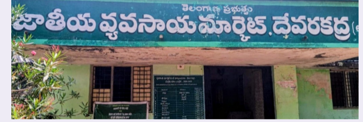
సిద్దిపేట టైమ్స్, మే 7, దేవరకర్ల మహబూబ్ నగర్ జిల్లా దేవరకర్ల పువసాయి మార్కెట్ యార్డుకు గురువారం రైతులు 378 క్వింటాళ్ల అరేబిన్ పరి ధాన్యాన్ని విక్రయానికి తీసుకువచ్చారు. వీటికి క్వింటాల్ కు అత్యధికంగా రూ. 2381 ధర పలికింది. అలాగే అతి తక్కువగా రూ. 2070 ధర పలికింది. అలాగే హంస ధాన్యాన్ని రైతులు విక్రయానికి తీసుకువచ్చారు. వీటికి క్వింటాల్ కు అత్యధికంగా రూ. 1779 ధర పలికింది. అతి తక్కువగా రూ. 1619 ధర పలికినట్లు మార్కెట్ అధికారులు తెలిపారు.