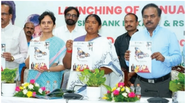
హైదరాబాద్ లోని ప్రజాభవన్ లో జరిగిన మహిళా స్వయం సహాయక సంఘాల వార్షిక రుణ ప్రజాశికారూ. 25,228.89 కోట్ల బ్యాంకు రుణాలకు