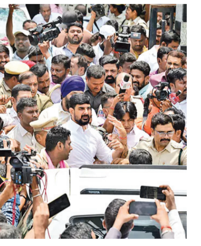
నందంలో సగం ఒక్కసారిగా అల్లాడిపోయింది. హుజూరాబాద్ ఎమ్మెల్యే పాడి కౌశిక్ రెడ్డి మీడియా వేదికగా చోటుచేసుకున్న ఈ పరిణామాలు ఇప్పుడు రాష్ట్రవ్యాప్తంగా చర్చనీయాంశంగా మారాయి. రెండు పార్టీల కార్యకర్తల మధ్య ఘర్షణ వాతావరణం నెలకొ

కరీంనగర్ రాజకీయం ఒక్కసారిగా సెగలు పుట్టిస్తోంది. కేంద్ర సహాయ మంత్రి బండి సంజయ్ ను వివాదాస్పద వ్యాఖ్యలు తీవ్ర ఉద్రిక్తతలకు దారితీసింది. ఎమ్మెల్యే గంగుల కమలాకర్ క్యాంప్ ఆఫీసు వేదికగా చోటుచేసుకున్న ఈ పరిణామాలు ఇప్పుడు రాష్ట్రవ్యాప్తంగా చర్చనీయాంశంగా మారాయి. రెండు పార్టీల కార్యకర్తల మధ్య ఘర్షణ వాతావరణం నెలకొ