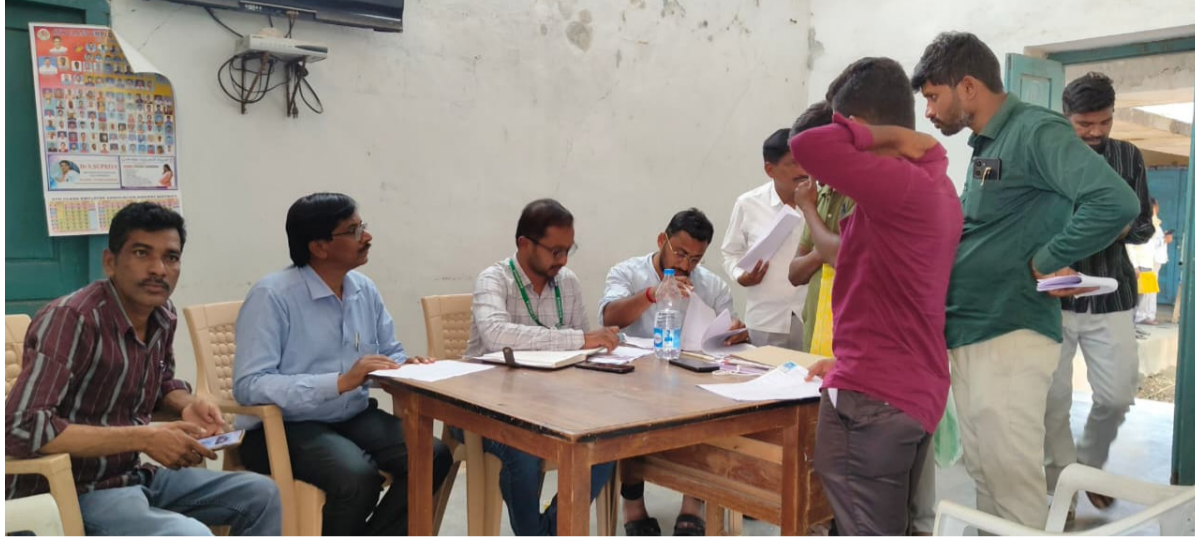
సీ మాట్లాడుతూ అర్హతలను ప్రతి లబ్ధిదారుడికి ప్రభుత్వం తీసుకుంటున్నామని తెలిపారు. పారదర్శకంగా ఎంపిక ప్రక్రియ కొనసాగుతోందని, ఎంపికైన వారికి బ్యాంకుల ద్వారా త్వరలోనే రుణాలు మంజూరు అవుతాయని పేర్కొన్నారు.

హైదరాబాద్, మే 7 (సిద్దిపేట టైమ్స్): ఎస్సీ కార్పొరేషన్ 202526 ఆర్థిక సంవత్సరానికి సంబంధించి ఆన్లైన్లో దరఖాస్తు చేసుకున్న లబ్ధిదారులకు గురువారం మండల కేంద్రంలో ఇంటర్వ్యూలు నిర్వహించారు. స్వయం ఉపాధి అవకాశాలను కల్పిస్తూ ఆర్థికంగా బలోపేతం చేయాలనే లక్ష్యంతో ప్రభుత్వం అమలు చేస్తున్న పథకాల కింద ఈ ఎంపిక ప్రక్రియ చేపట్టినట్లు అధికారులు తెలిపారు. మండలంలోని వివిధ గ్రామాలకు చెందిన అభ్యర్థులు హాజరై తమ దరఖాస్తులకు సంబంధించిన ప్రవచనాలను సమర్పించారు. బ్యాంకు అధికారులు లబ్ధిదారుల అర్హతలు, ప్రతిపాదించిన యూనిట్ల సాధ్యత, ఆర్థిక పరిస్థితులను పరిశీలిస్తూ ఇంటర్వ్యూలు నిర్వహించారు. యువత స్వయం ఉపాధి దిశగా ముందుకు రావాలని, ప్రభుత్వం అందిస్తున్న రుణ సదుపాయాలను సద్వినియోగం చేసుకోవాలని అధికారులు సూచించారు. ఈ సందర్భంగా ఎంపికీతో అభ్యర్థి