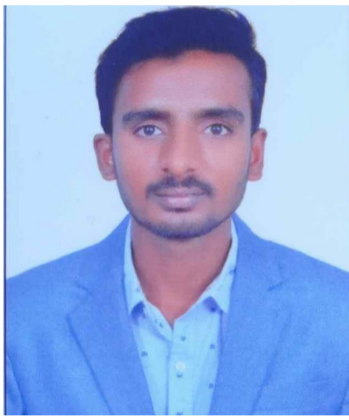
కార్యక్రమాన్ని విజయవంతం చేయాలని కోరారు.