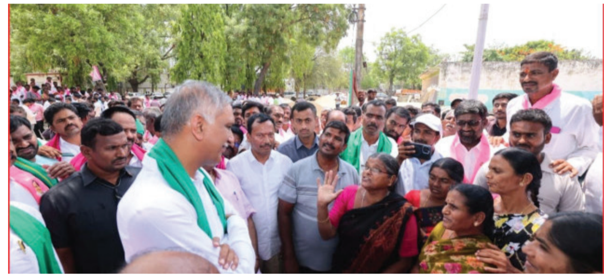
ని, క్షేత్రస్థాయిలో రైతులు తీవ్ర ఇబ్బందులు పడుతున్నారని ఆయన మండిపడ్డారు. తాను మంత్రుల్లా వీసీ గడుల్లో కూర్చుని మాట్లాడటం లేదని, నేరుగా రైతులకు మద్దతు నిలబడి వారి గొంతు వింటున్నానని హరికే రావు అన్నారు. కల్లాలో ధాన్యం అమ్మకోవడానికి రైతులు నానా అవస్థలు పడుతున్నారని ఆరోపించారు. తమ లేదని దుఃఖితులైతారు. ధాన్యం కొనుగోళ్ల సక్రమంగా జరుగుతున్నాయని మంత్రి ఉత్తమ కుమార్ రెడ్డి చెబుతున్న మాటలు వాస్తవాలకు విరుద్ధంగా ఉన్నాయ

వద్ద కుప్పల వద్ద రైతుల గుండెలు ఆగిపోతున్నా ముఖ్యమంత్రి రేవంకె రెడ్డికి కనీస కనికరం లేదని బీఆర్ఎస్ సీనియర్ ఎమ్మెల్యే హరికే రావు మండిపడ్డారు. కేసీఆర్ హయాంలో తెలంగాణలో ఇలాంటి దుస్థితిని ఎప్పుడూ చూడలేదని ఆయన ఆవేదన వ్యక్తం చేశారు. యాదాద్రి భువనగిరి జిల్లా చౌటుప్పల్ వ్యవసాయ మార్కెట్ లోని ధాన్యం కొనుగోలు కేంద్రాన్ని సందర్శించిన ఆయన, అక్కడ నెలకొన్న పరిస్థితులపై తీవ్ర ఆగ్రహం వ్యక్తం చేశారు. రాష్ట్రవ్యాప్తంగా ధాన్యం కొనుగోళ్లలో ప్రభుత్వం తీవ్ర నిర్లక్ష్యం ప్రదర్శిస్తోందని హరికే రావు విమర్శించారు. నెల రోజులుగా రైతులు వద్దకో కల్లాలోనే వేచి చూస్తున్నా కొనుగోళ్లు జరగడం లేదని దుఃఖితులైతారు. ధాన్యం కొనుగోళ్ల సక్రమంగా జరుగుతున్నాయని మంత్రి ఉత్తమ కుమార్ రెడ్డి చెబుతున్న మాటలు వాస్తవాలకు విరుద్ధంగా ఉన్నాయ