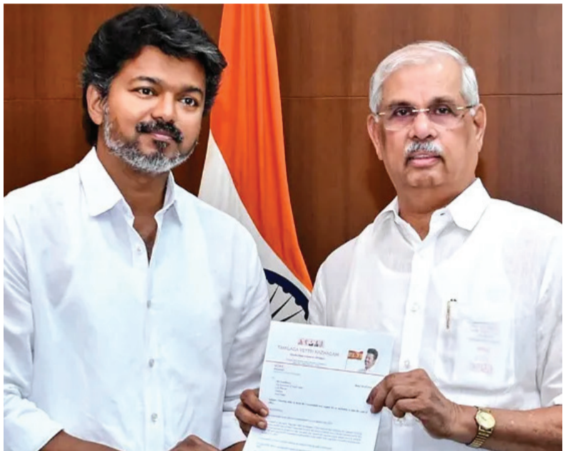
రూపించుకుంటానని హామీ ఇచ్చారు. అయితే కేవలం ఆరుగురు ఎమ్మెల్యేల మద్దతు మాత్రమే తక్కువగా ఉన్నందున, అతిపెద్ద పార్టీగా తమిళగ వెల్లి అవకాశం ఇవ్వాలని నేడు విజయ్ స్వయంగా కోరసప్పటికీ గవ

తమిళనాడు అసెంబ్లీ ఎన్నికల ఫలితాల అనంతరం ప్రభుత్వ ఏర్పాటుపై నెలకొన్న సందిగ్ధత కొనసాగుతోంది. రాష్ట్రంలో అతిపెద్ద పార్టీగా అవతరించిన తమిళగ వెల్లి కళగం (టీవీకే) పార్టీకి ప్రభుత్వ ఏర్పాటుకు అవకాశం ఇవ్వాలని కోరుతూ ఆ పార్టీ అధినేత విజయ్ గురువారం రెండోసారి లోక్ భవన్ వెళ్లారు. అయితే గవర్నర్ నుండి ఆయనకు మరోసారి సానుకూల స్పందన లభించకపోవడంతో విజయ్ బృందానికి నిరాశే ఎదురైంది. బుధవారం నాడే విజయ్ 113 మంది ఎమ్మెల్యేల జాబితాను గవర్నర్ కు సమర్పించి, తనకు అవకాశం ఇస్తే సభలో మెజార్స్ ని