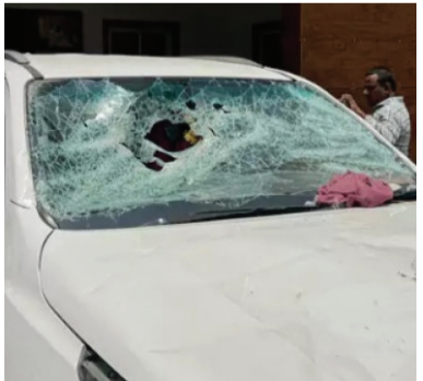
లీనులకు, కార్యకర్తలకు మధ్య జరిగిన తోపులాటలో పలువురు బీజేపీ కార్యకర్తలకు గాయాలయ్యాయి. పరిస్థితిని అదుపులోకి తెచ్చేందుకు పోలీసులు శతవిధాల ప్రయత్నించినప్పటికీ, ఇరు వర్గాల మధ్య తోపులాటలు జరగడంతో అక్కడ యుద్ధ వాతావరణం కనిపించింది. ప్రస్తుతం కరీంనగర్ పట్టణంలో ఉద్రిక్త పరిస్థితులు కొనసాగుతుండటంతో పోలీసులు అదనపు బలగాలను మోహరించిన నిమాను పెంచారు. గంగుల క్యాంపులో వద్ద భారీగా పోలీసులను మోహరించి అదుపులోకి తెచ్చేందుకు పోలీసులు శతవిధాల ప్రయత్నించినప్పటికీ, ఇరు వర్గాల మధ్య తోపులాటలు జరగడంతో అక్కడ యుద్ధ వాతావరణం కనిపించింది. ప్రస్తుతం కరీంనగర్ పట్టణంలో ఉద్రిక్త పరిస్థితులు కొనసాగుతుండటంతో పోలీసులు అదనపు బలగాలను మోహరించిన నిమాను పెంచారు. గంగుల క్యాంపులో వద్ద భారీగా పోలీసులను మోహరించి అదుపులోకి తెచ్చేందుకు పోలీసులు శతవిధాల ప్రయత్నించినప్పటికీ, ఇరు వర్గాల మధ్య తోపులాటలు జరగడంతో అక్కడ యుద్ధ వాతావరణం కనిపించింది. ప్రస్తుతం కరీంనగర్ పట్టణంలో ఉద్రిక్త పరిస్థితులు కొనసాగుతుండటంతో పోలీసులు అదనపు బలగాలను మోహరించిన నిమాను పెంచారు. గంగుల క్యాంపులో వద్ద భారీగా పోలీసులను మోహరించి అదుపులోకి తెచ్చేందుకు పోలీసులు శతవిధాల ప్రయత్నించినప్పటికీ, ఇరు వర్గాల మధ్య తోపులాటలు జరగడంతో అక్కడ యుద్ధ వాతావరణం కనిపించింది. ప్రస్తుతం కరీంనగర్ పట్టణంలో ఉద్రిక్త పరిస్థితులు కొనసాగుతుండటంతో పోలీసులు అదనపు బలగాలను మోహరించిన నిమాను పెంచారు. గంగుల క్యాంపులో వద్ద భారీగా పోలీసులను మోహరించి అదుపులోకి తెచ్చేందుకు పోలీసులు శతవిధాల ప్రయత్నించినప్పటికీ, ఇరు వర్గాల మధ్య తోపులాటలు జరగడంతో అక్కడ యుద్ధ వాతావరణం కనిపించింది. ప్రస్తుతం కరీంనగర్ పట్టణంలో ఉద్రిక్త పరిస్థితులు కొనసాగుతుండటంతో పోలీసులు అదనపు బలగాలను మోహరించిన నిమాను పెంచారు. గంగుల క్యాంపులో వద్ద భారీగా పోలీసులను మోహరించి అదుపులోకి తెచ్చేందుకు పోలీసులు శతవిధాల ప్రయత్నించినప్పటికీ, ఇరు వర్గాల మధ్య తోపులాటలు జరగడంతో అక్కడ యుద్ధ వాతావరణం కనిపించింది. ప్రస్తుతం కరీంనగర్ పట్టణంలో ఉద్రిక్త పరిస్థితులు కొనసాగుతుండటంతో పోలీసులు అదనపు బలగాలను మోహరించిన నిమాను పెంచారు. గంగుల క్యాంపులో వద్ద భారీగా పోలీసులను మోహరించి అదుపులోకి తెచ్చేందుకు పోలీసులు శతవిధాల ప్రయత్నించినప్పటికీ, ఇరు వర్గాల మధ్య తోపులాటలు జరగడంతో అక్కడ యుద్ధ వాతావరణం కనిపించింది. ప్రస్తుతం కరీంనగర్ పట్టణంలో ఉద్రిక్త పరిస్థితులు కొనసాగుతుండటంతో పోలీసులు అదనపు బలగాలను మోహరించిన నిమాను పెంచారు. గంగుల క్యాంపులో వద్ద భారీగా పోలీసులను మోహరించి అదుపులోకి తెచ్చేందుకు పోలీసులు శతవిధాల ప్రయత్నించినప్పటికీ, ఇరు వర్గాల మధ్య తోపులాటలు జరగడంతో అక్కడ యుద్ధ వాతావరణం కనిపించింది. ప్రస్తుతం కరీంనగర్ పట్టణంలో ఉద్రిక్త పరిస్థితులు కొనసాగుతుండటంతో పోలీసులు అదనపు బలగాలను మోహరించిన నిమాను పెంచారు. గంగుల క్యాంపులో వద్ద భారీగా పోలీసులను మోహరించి అదుపులోకి తెచ్చేందుకు పోలీసులు శతవిధాల ప్రయత్నించినప్పటికీ, ఇరు వర్గాల మధ్య తోపులాటలు జరగడంతో అక్కడ యుద్ధ వాతావరణం కనిపించింది. ప్రస్తుతం కరీంనగర్ పట్టణంలో ఉద్రిక్త పరిస్థితులు కొనసాగుతుండ

కలిపి తీసుకోవడం వల్లే ఆయనకు బట్టల పచ్చిందని ఘోషించారు. కేబీఆర్ పై అసంతృప్తి వ్యాఖ్యలు చేస్తే సహించేది లేదని హెచ్చరించిన ఆయన, డ్రగ్స్, టెక్నాలజీ తాము సిద్ధమని, బండి సంజయ్ కూడా రావాలని సవాల్ విసిరారు. గతంలో ఎన్నికల ఖర్చు కోసం భార్య పుస్తెలు అమ్మినట్లు చెప్పిన సంజయ్, ఇప్పుడు వేల కోట్లు ఎక్కడి నుంచి తెస్తున్నారని నిలదీశారు. ఈ వ్యాఖ్యలతో ఆగ్రహించిన బీజేపీ కార్యకర్తలు భారీ సంఖ్యలో గంగుల కమలాకర్ క్యాంప్ ఆఫీసును ముట్టడించారు. కౌశిక్ రెడ్డి లోపల డ్రెస్ మీట్ నిర్వహిస్తుండగానే, ఆగ్రహంతో ఉగ్రమయిన బీజేపీ శ్రేణులు బయట ఉన్న ఆయన కారుపై దాడి చేసి అడ్డాలను ధ్వంసం చేశారు. అంతేకాకుండా, క్యాంప్ ఆఫీసులోకి చొచ్చుకొని అక్కడి ఫర్నిచర్ ను కూడా ధ్వంసం చేశారు. బండి సంజయ్ కు కౌశిక్ రెడ్డి అనే పోలీసులు రంగం ప్రవేశం చేశారు. క్యాంప్ ఆఫీసు ముట్టడికి ప్రయత్నించిన బీజేపీ శ్రేణులను అడ్డుకోవడానికి పోలీసులు లాటిచ్చార్స్ చేశారు. ఈ క్రమంలో పో