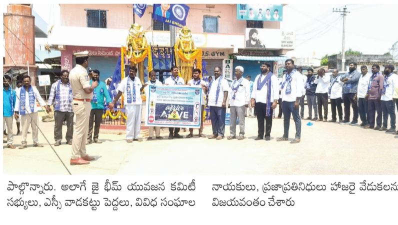
పాల్గొన్నారు. అలాగే జై భీమ్ యువజన కమిటీ నాయకులు, ప్రజాప్రతినిధులు హాజరై వేడుకలను సభ్యులు, ఎస్సీ వాడకట్టు పెద్దలు, వివిధ సంఘాల విజయవంతం చేశారు