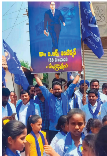
దౌలాబాద్ ఏప్రిల్ 14(సిద్దిపేట టైమ్స్ )