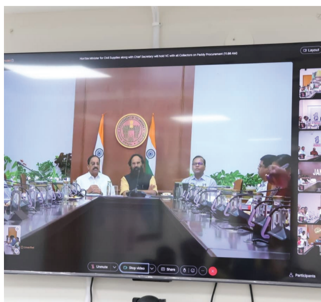
-మంత్రి తుమ్మల నాగేశ్వర రావు ధాన్యం కొనుగోళ్లపై మంత్రుల సమీక్ష.. సిద్దిపేట టైమ్స్, సిద్దిపేట అక్టోబర్ 15